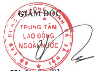
Hà Xuân Tùng